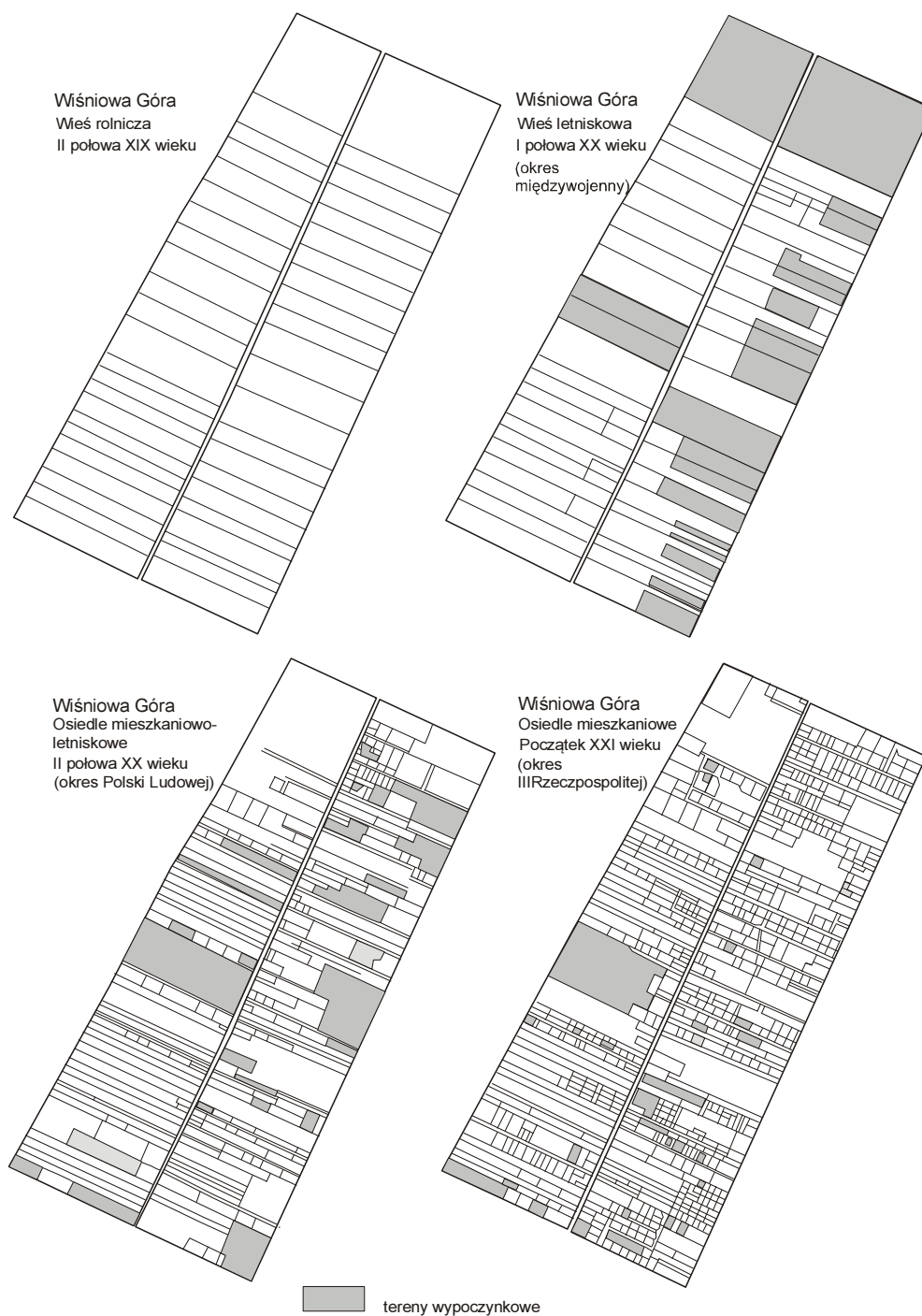
Rys. 1. Zmiany morfologii (układu przestrzennego) Wiśniowej Góry w latach 1870–2008 jako ilustracja procesu urbanizacji podmiejskiego osiedla letniskowego

okolicznej ludności pracującej w Łodzi (a niemogącej uzyskać w niej zameldowania) do osiedli podmiejskich, zwłaszcza tych, które dysponowały wolnymi zasobami mieszkaniowymi. A do takich osiedli podmiejskich należała m.in. Wiśniowa Góra. Opuszczone wille i pensjonaty częściowo przekształcono na mieszkania dla ludności stałej. Dlatego już w 1946 r. Wiś-